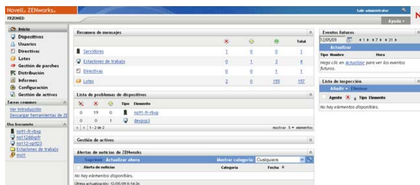
Figura 1-2 Centro de control de ZENworks

El Centro de control de ZENworks se instala en todos los servidores primarios de la zona de gestión. Todas las tareas de gestión se pueden llevar a cabo en cualquiera de los servidores primarios. Dado que se trata de una consola de gestión basada en Web, se puede acceder al Centro de control de ZENworks desde cualquier estación de trabajo compatible .