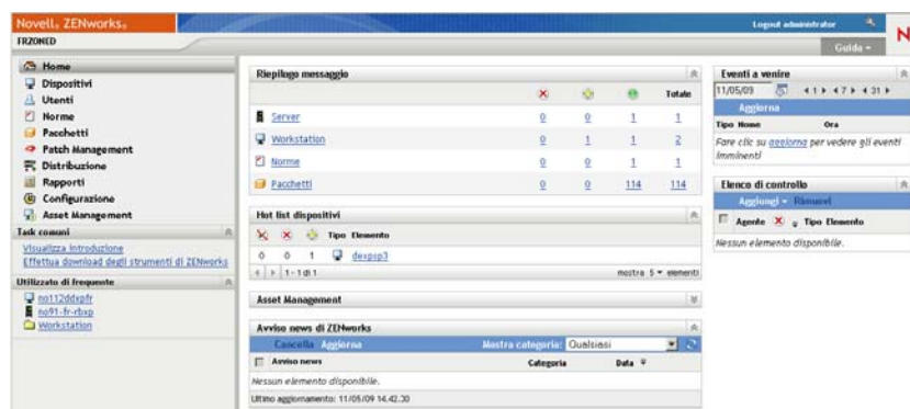
Figura 1-2 Centro di controllo ZENworks

Il sistema ZENworks viene amministrato a livello di zona di gestione tramite il Centro di controllo ZENworks (ZCC), una console con browser Web basata su task. Nel grafico riportato di seguito è illustrata la sezione di ZCC visualizzata tramite il browser Web: