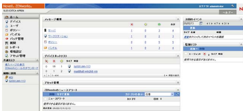
図 1-2 ZENworks コントロールセンター

ZCC は、管理ゾーンのすべてのプライマリサーバにインストールされます。どのプライマリサーバでも、すべての管理タスクを実行できます。Web ベースの管理コンソールであるため、ZCC はサポートされているワークステーションからアクセスできます。