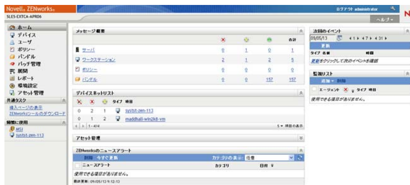
図 1-2 ZENworks コントロールセンター

ZCC は、管理ゾーンのすべてのプライマリサーバにインストールされます。どのプライマリサーバでも、すべての管理タスクを実行できます。Web ベースの管理コンソールであるため、ZCC はサポートされているワークステーションからアクセスできます。