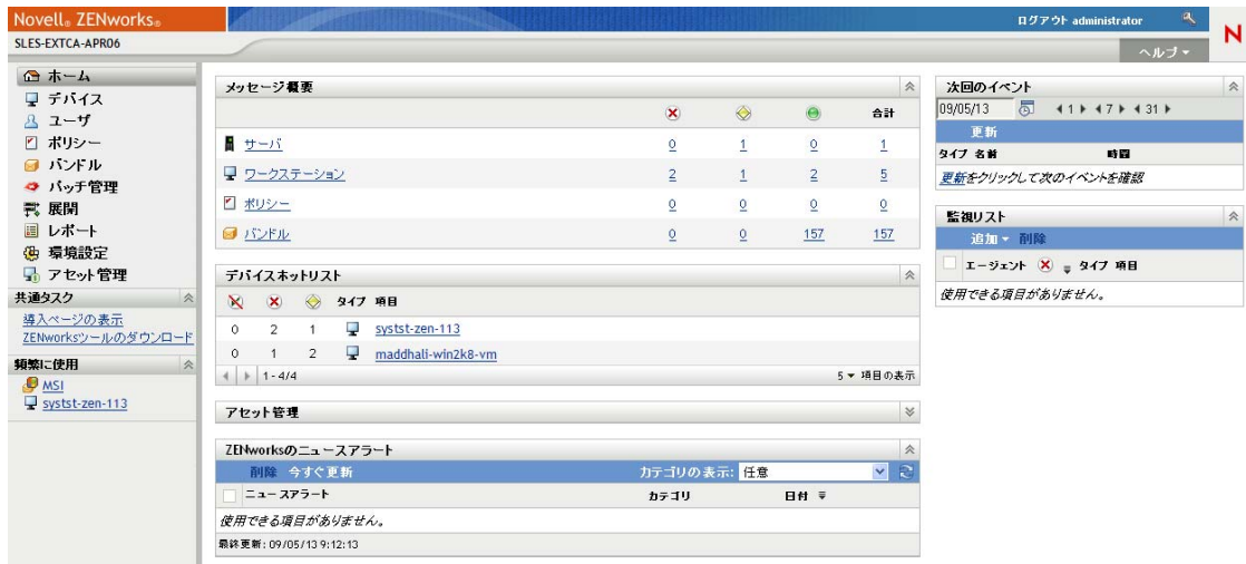
図 1-2 ZENworks コントロールセンター

ZCC は、管理ゾーンのすべてのプライマリサーバにインストールされます。どのプライマリサーバでも、すべての管理タスクを実行できます。ZCC は、Web ベースの管理コンソールなので、任意のサポートされているワークステーションからアクセスできます。