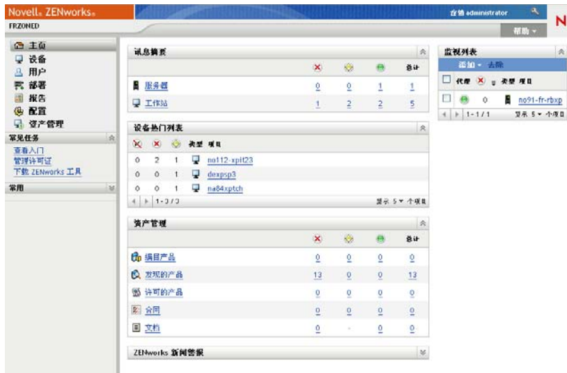
图 1-2 ZENworks 控制中心

ZCC 安装于“管理区域”中的所有“主服务器”上。您可以在任意一个“主服务器”上执行所有管理任务。由于 ZCC 是基于万维网的管理控制台，因此它可以从任意支持的工作站访问。