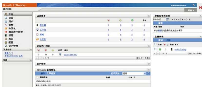
图 1-2 ZENworks 控制中心

ZCC 安装于“管理区域”中的所有“主服务器”上。您可以在任意一个“主服务器”上执行所有管理任务。由于 ZCC 是基于万维网的管理控制台，因此它可以从任意支持的工作站访问。