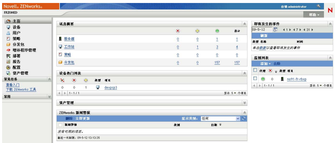
图 1-2 ZENworks 控制中心

ZCC 安装于“管理区域”中的所有“主服务器”上。您可以在任意一个“主服务器”上执行所有管理任务。由于 ZCC 是基于 Web 的管理控制台，因此可从任意支持的工作站对其进行访问。