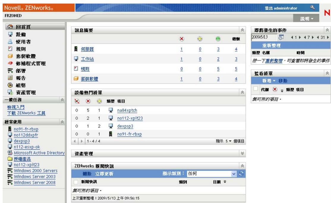
圖 1-2 ZENworks 控制中心

管理區內所有的主要伺服器皆會安裝 ZCC。您可以在任一部主要伺服器上執行所有的管理工作。由於 ZCC 屬於 Web 型管理主控台，因此您可以從任何受支援的工作站上加以存取。